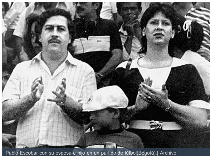
Pablo Escobar con su esposa e hijo en un partido de fútbol(Bogotá).

■ El informe establece la responsabilidad del Gobierno colombiano