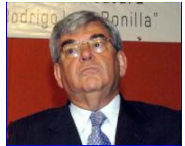
Comisión confirma ejecuciones y denuncia indolencia del Estado colombiano en el Palacio